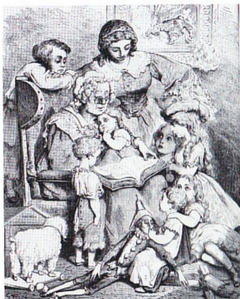
GUSTAVE DORÉ: TITELPAGINA (1867) VAN LES CONTES DE MA MÈRE L'OYE - MISSCHIEF WEL EEN VAN DE LIEVELINGSBOEKEN VAN MAURICE RAVEL

sessen die door de boze tovenaars Kasjtsjejev gevangen worden gehouden. De vuurvogel schiet Ivan te hulp en de betovering wordt verbroken. Koning Kasjtsjejev en zijn gevolg verdwijnen dansend in de afgrond en Ivan verklaart zijn prinses de liefde. De vernieuwende muziek heeft de dansers in eerste instantie ongetwijfeld flink geschokt. Anna Pavlova, de prima ballerina van het gezelschap, riep zelfs uit dat ze op zulke onzin niet wenste te dansen. Haar rol ging vervolgens naar de jonge Tamara Karsavina. Stravinsky oefende